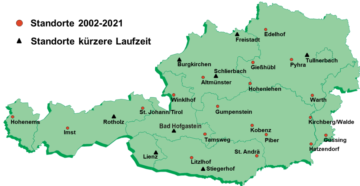
Abbildung 1: Verteilung der Versuchsstandorte im Forschungsprojekt DW-NET in Österreich

Resch et al. 2017) und dem aktuellen DaFNE-Projekt 101309 „Langzeitauswirkungen differenzierter Bewirtschaftungsintensität von Dauerwiesen unter besonderer Berücksichtigung ökonomischer und ökologischer Effekte“ (Resch 2021).