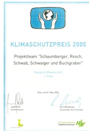
Abbildung 3: Überreichung Klimaschutzpreis 2005 an das Gumpensteiner Forscherteam durch Bundesminister Josef Pröll