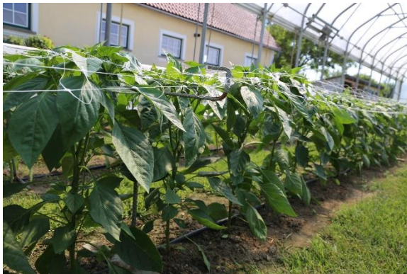
Abb. 2: Aufleitsystem beim Spitzpaprika-Sortenversuch im kalten Biofolientunnel, (Außenstelle Zinsenhof), Metallsteher, waagrechte Netze